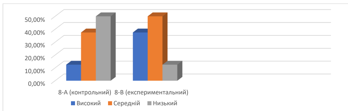
Рис. 1. Діаграма порівняння рівнів креативності здобувачів освіти на констатувальному етапі дослідження

Метою наступного кроку констатувального експерименту було з'ясування рівня навчальних досягнень учнів з біології у 8-А (контрольний з математичним спрямуванням) та 8-В (експериментальний з біолого-хімічним спрямуванням) класах. Також зробити висновок: чи є залежність рівня навчальних досягнень з біології від типів мислення та рівнів креативності здобувачів освіти.