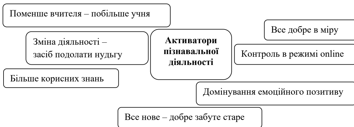
Схема 2. Активатори учнівської пізнавальної діяльності

інтерес можна за допомогою семінарських занять з використанням інформаційних технологій. Завжди є місце урокам-проектам; «Більше корисних знань» – значущість того, що вивчається доводиться до відома учнів не тільки на початку курсу, теми, а й на початку кожного уроку. Значну увагу учитель-методист приділяє до профільній підготовці, основна мета якої – підготувати учнів до свідомого вибору біологічного профілю; «Все нове – добре забуте старе» інформація буде цікавою, якщо поєднувати нове з добре відомим; «Все добре в міру» – завдання не має бути занадто легким і занадто важким, а будуватися за принципом від простого до складного, враховуючи вікові та індивідуальні особливості учня, використовуючи аналогії, порівняння, протиставлення, виокремлення головного; «Контроль в режимі online» – практикувати різні форми контролю: тест, самостійна робота, диктант; «Домінування емоційного позитиву» емоційний вплив – один із потужніших активаторів учнівської зацікавленості. Позитивне налаштування в просторі того, що вивчається, очевидна захопленість вчителя предметом не залишають байдужими більшість учнів [4, с. 23].