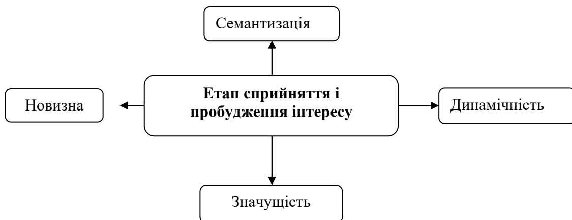
Схема 3. Прийоми управління активізацією пізнавальної діяльності на етапі сприйняття і пробудження інтересу

Прийоми активізації навчальної діяльності учнів на етапі засвоєння матеріалу, що вивчається: евристичний прийом – задаються важкі питання і за допомогою навідних питань приводять до відповіді; дослідницький прийом – що вчать на основі проведених спостережень, дослідів, аналізу літератури, рішення пізнавальних завдань повинні сформулювати висновків. Прийоми активізації пізнавальної діяльності на етапі відтворення отриманих знань.